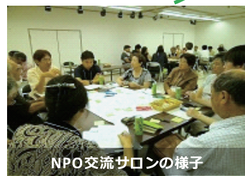
NPO交流サロンの様子