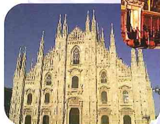
ミラノのドゥオモ

水の都ヴェネチアから、中世の面影が残る3都市を訪問 華やかなミラノを後にし、ウィーンの宮廷文化にふれる… ヨーロッパ美術の真髄を辿り、6都市を巡る盛り沢山な内容です