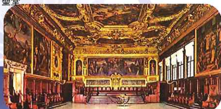
ヴェネチアのドゥカーレ宮殿