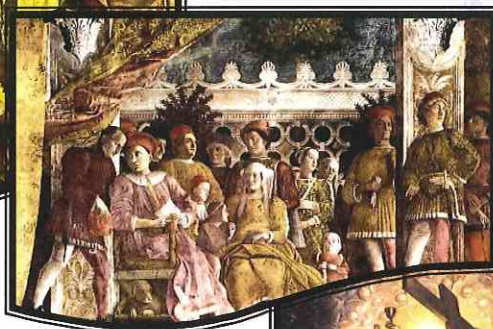
マンテーニャ『結婚の間』