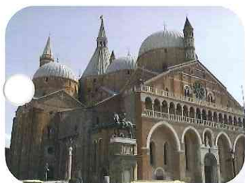
バドヴァのサンタントニオ聖堂